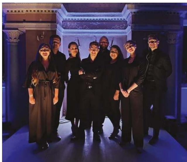
ZESPÓŁ WOKALNY AFFECTUS

Lusowskie Spotkania Muzyczne – tegoroczny cykl: 7.07, 4.08 i 1.09 (niedziele), g. 13, kościół pw. św. Jadwigi i św. Jakuba Apostoła w Lusowie. Wstęp wolny