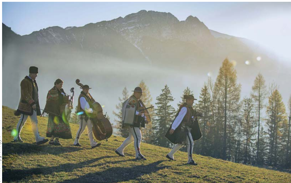
fol. materiały promocyjne