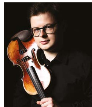
Fot. materiały promocyjne, 4x