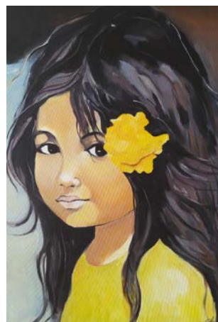
Fot. Magdalena Łuczak, praca z wystawy

charytatywnych akcji na rzecz dzieci, uhonorowana Orderem Uśmiechu, zmarła w roku 2022, w wieku 90 lat. Pozostawiła po sobie spuściznę w postaci kolorowych pocztówek, które kiedyś