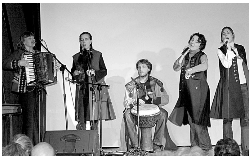
śpiewu. „Czerwony mosteczek”, „Czerwone jabłuszko”, „Gęsi za

Sposób w jaki wykonywali piosenki znane z dzieciństwa naszych rodziców i dziadków sprawiał, że ludzie chętnie włączali się do