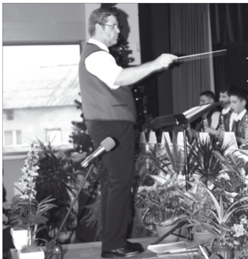
Fot. J. Pluciński 13x

Pana największe przeżycie estradowe związane z orkiestrą?